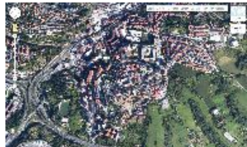
Altza (Donostia).

Gutxi batzuek aberasteko duten grinarengatik, garapen ekonomiko azkarra eta gainbalioa metatzeko nahia jartzen dituzte beste ezeren aurretik. Kapitalismo basatia eta globalizazioa, jaun eta jabe.