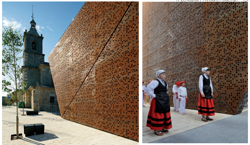
Argazki eta planoak: BLUR arquitectura