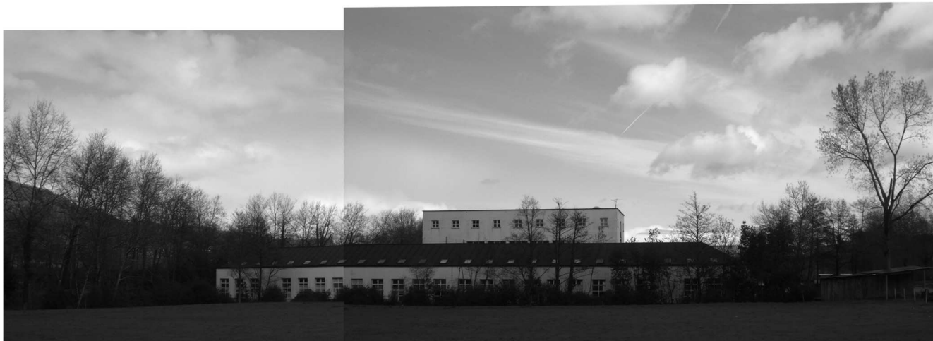
Ikastolaren egungo egoera