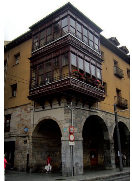
Bilboko Erribera kaleko begiratokia.

Baserrria. Landa-guneko eraikuntzari deitzen diogu. Nekazari-rien bizitza eta produkzioa egokitutako pieza isolatuak dira. Itxura mantendu du mendetan zehar. Paralelepipedo baten gainean dagoen bi isuriko teilatuak izaera berezia ematen dio. Ekoizte-gune bezala, XII. eta XIII. mendeetan du jatorria baserriak, nahiz eta gaur egun ezagutzen dugun eraikin-tipologiak XV. mendearen bukaeran hasi ziren.