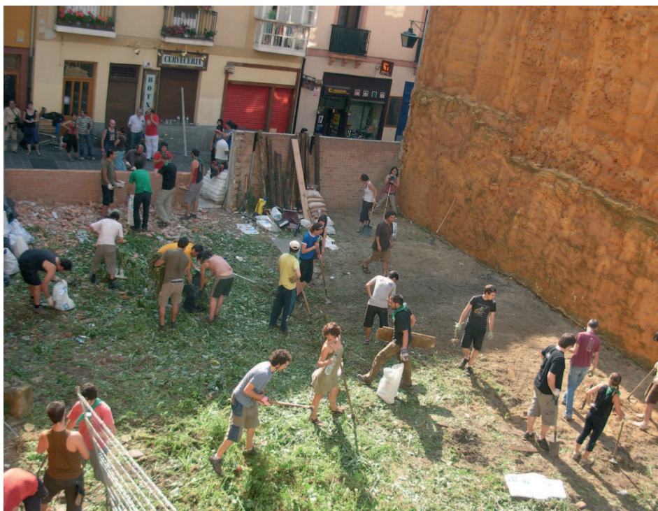
Bolo-bolo bolatokia prestatzeko auzolana