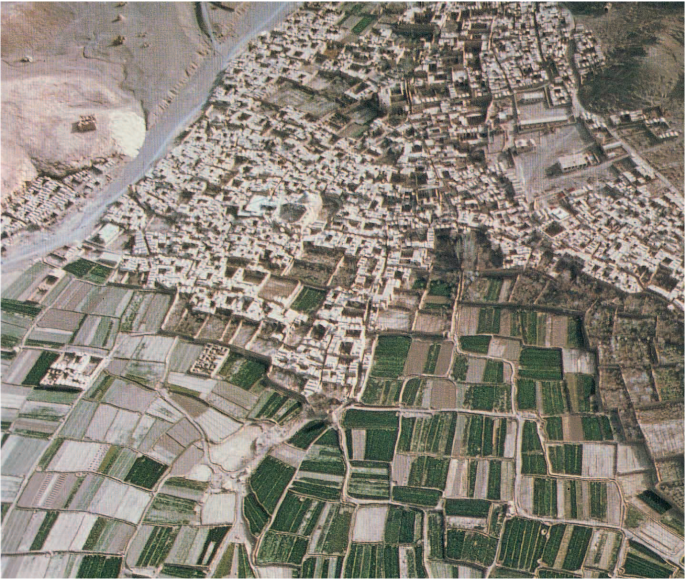
Landa partzelazioaren eta hiri-partzelazioaren arteko lotura. Nowdushan, Yazd, Iran.