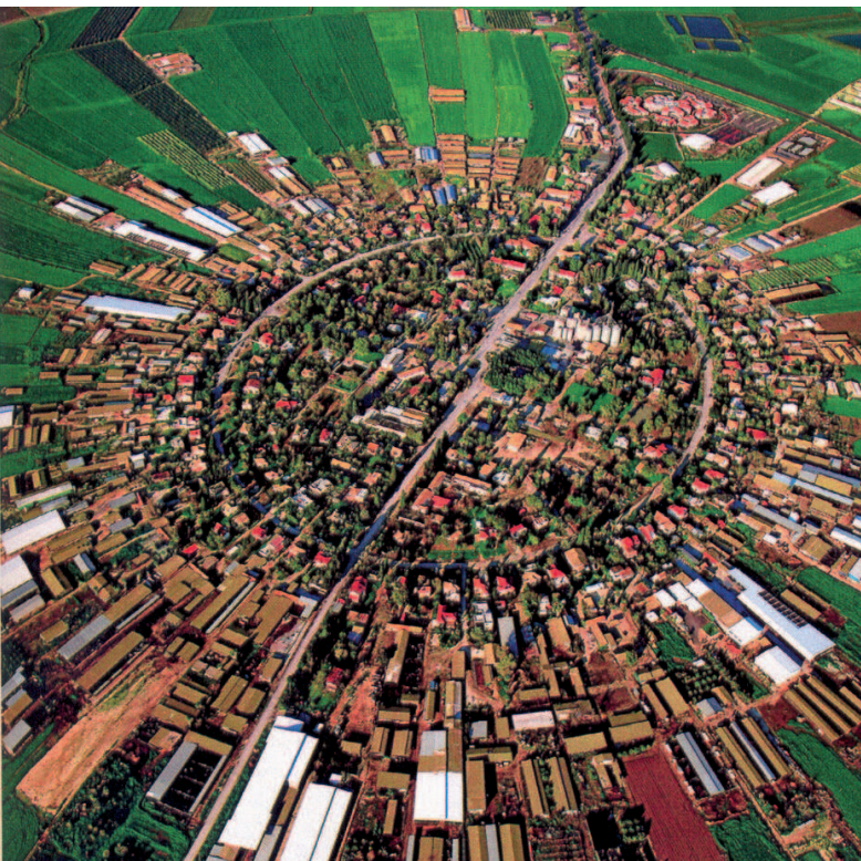
Nahalal moshava, Israel. Richard Kauffmann, 1921.