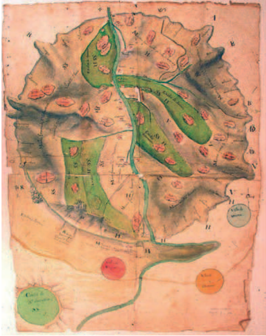
1773ko saraien kokapen-planoak. Urumea ibarra. Gipuzkoa.