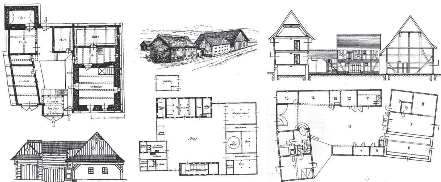
Patioen inguruan eraikitako landetxe zatikatuak. Borová u Policky (Eslovakia), Innvierthl (Austria) eta Frankonia (Alemania).